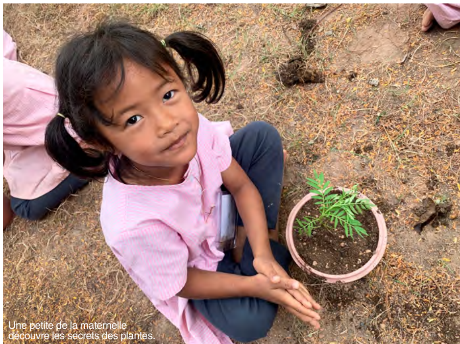
Une petite de la maternelle découvre les secrets des plantes.